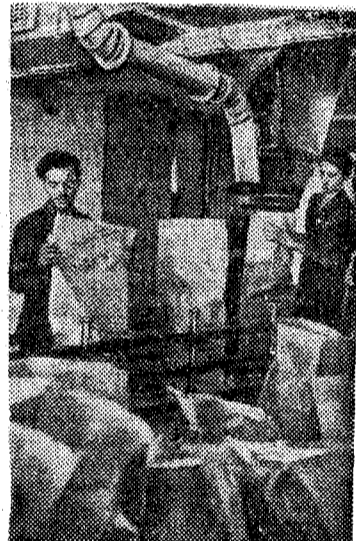
Венгерская Народная Республика. На химическом комбинате «Тисса» началось пробное производство азотных удобрений. Уже в этом году новый химический гигант даст стране 40 тысяч тонн удобрений.