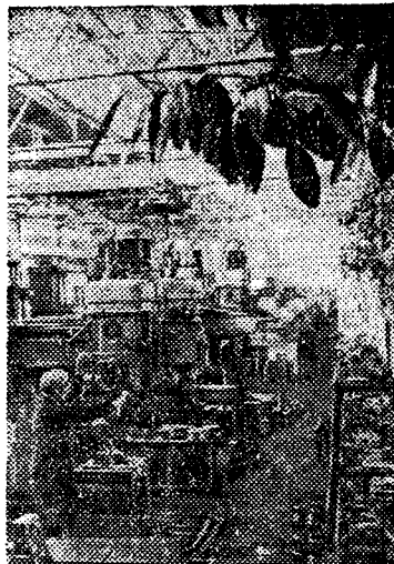
Челябинская область. Копейский машиностроительный завод имени Кирова специализируется на выпуске горношахтного оборудования для проходческих и очистных работ.

Работники завода борются за культуру производства. Больших успехов в этом достиг коллектив цеха № 3. Уголок этого цеха показан на снимке.