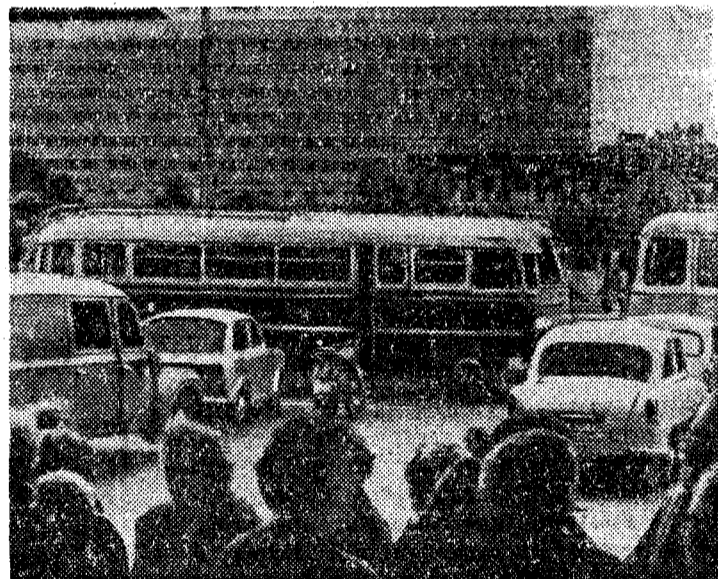
Лейпциг — центр традиционных весенних и осенних ярмарок, международных конгрессов и конференций. Здесь, как ни в одном другом городе Германской Демократической Республики, всегда много зарубежных гостей. Для них на при-вокзальной площади, напротив крупнейшего в Европе железнодорожного вокзала, построено здание новой гостиницы «Город Лейпциг».

роны Макелроя, генерала Туайнинга, адмирала Рэдфорда и других сторонников превентивной войны, в котором они поддерживают идею Голдуотера о передаче генералам НАТО права применять ядерное оружие без санкции президента США.