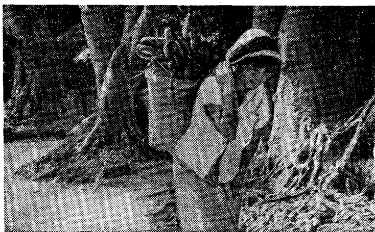
В 300 километрах от острова Кюсю — южной оконечности Японии — находятся острова Амамио-сима. Основными статьями дохода на островах являются выращивание чесуци и сахарного тростника. Население, которое нещадно эксплуатируется крупными японскими фирмами по переработке сахарного тростника и оптовыми дельцами, живет в постоянной нищете. На снимке: женщина-крестьянка несет корзину с бананами, доход от которых едва может прокормить семью.