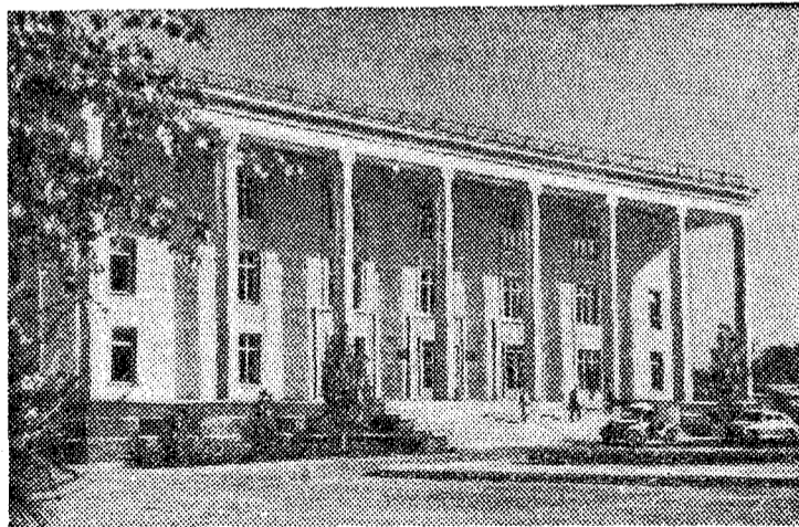
Ашхабад. Здание президиума Академии наук Туркменской ССР.