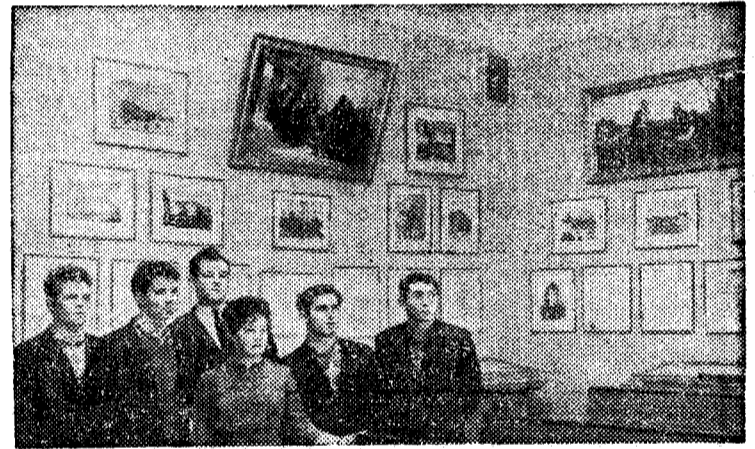
Казанский государственный университет имени В. И. Ульянова-Ленина — одно из старейших учебных заведений страны. Здесь на юридическом факультете учился В. И. Ленин, здесь получил он свое революционное крещение. Из стен университета вышли многие выдающиеся деятели науки, литературы, искусства — Н. И. Лобачевский, С. Т. Аксаков, Н. Н. Зинин, А. М. Бутлеров, Л. Н. Толстой, М. А. Балакирев.

За годы Советской власти университет окончило более 17 тысяч человек. Теперь это не только учебное, но и крупное научное учреждение.