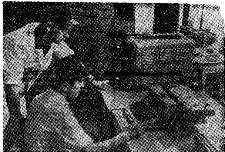
Первая электронно-счетная машина появилась в рыбной промышленности Германской Демократической Республики. Эта установка (на снимке) будет служить диспетчерским пультом для новой консервной поточной линии. В течение секунд она сможет производить экономические расчеты, на выполнение которых обычно затрачивалось не менее двух дней.