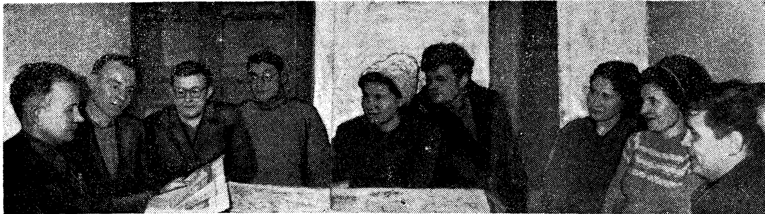
Трудящиеся шахты «Полысаевская-2» с интересом знакомятся с материалами сессии Верховного Совета СССР. Агитаторы проводят читки, беседы.

Зиму учащиеся встречают в спортивной форме.