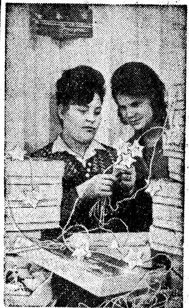
Харьковская фабрика пластмассовых изделий выпускает 30 видов продукции из полистирола и полиэтилена.

(Передовая «Правды» за 22 декабря 1964 г.)