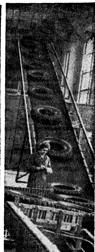
Волгоградская область. Наравивает мощность шинный завод Волжского химкомбината. Достигнут намеченный по плану рубеж. До конца года производство шин значительно возрастет.