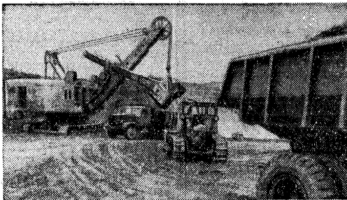
Монгольская Народная Республика. В Шаринголе, в 70 километрах от Дархана, открыто богатое месторождение бурого угля. Здесь с помощью Советского Союза сооружается открытый угольный карьер, в котором будет добываться до миллиона тонн угля в год.

В управлении участники похода потребовали «пищи» и «работы». Они устроили сидячую демонстрацию прямо в коридорах управления и заявили, что не покинут здание до тех пор, пока «не добьются удовлетворения своих требований».