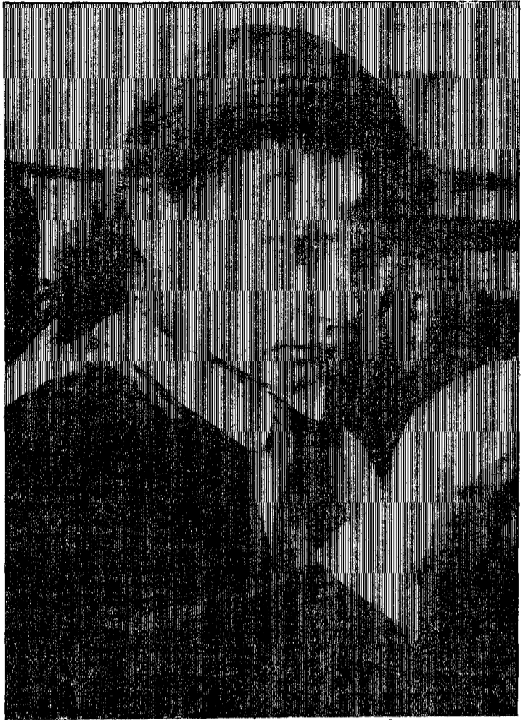
В школьной мастерской