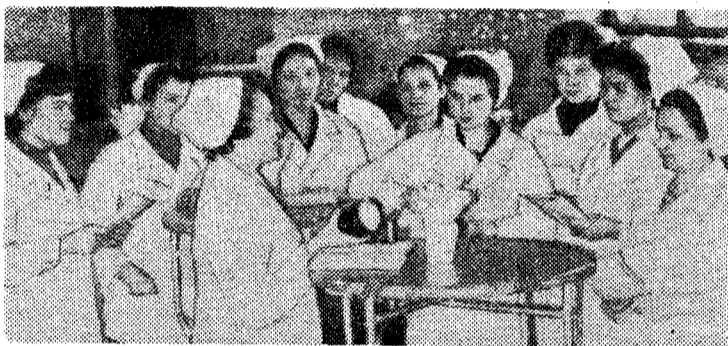
В «Гастрономе» № 5 на общественных началах работает кружок торгового мастерства, где продавцы успешно повышают свои знания. На снимке: на занятиях кружка.