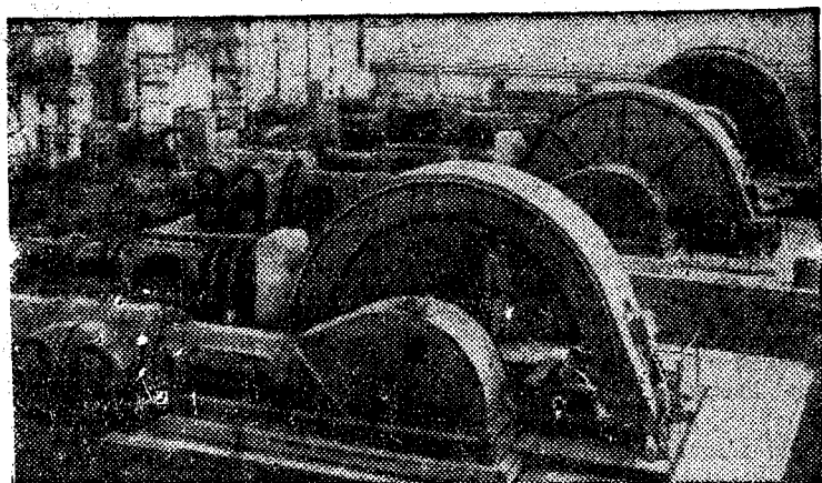
Гигантский химический комбинат «Тисса» сооружается в области Боршод Венгерской Народной Республики. Строительство будет завершено в текущем году. Основное оборудование для предприятия поставляют заводы Советского Союза.

На снимке: советские компрессоры в цехе комбината.