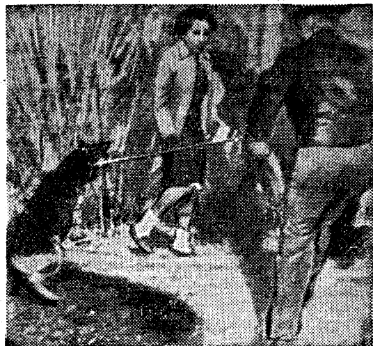
В Соединенных Штатах Америки негры продолжают борьбу за равные права. Расисты нередко с помощью властей творят зверские расправы над цветным населением. На этом снимке, опубликованном в английской газете «Дейли телеграф», полицейский наусукивает собаку на негритянку — участницу демонстрации против расовой сегрегации в городе Принсес-Анн (штат Мэриленд).

и в скромной книжной лавке Латинского квартала. В последнее время список книг советских писателей, переведенных на французский язык, растет особенно быстро. В нем десятки произведений от многотомного собрания сочинений М. Горького до тоненькой тетрадки «Дне в жизни Нины Костериной».