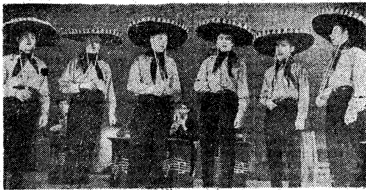
Окончилась официальная часть слета дружинников, и на сцене появились самодеятельные артисты. Для добровольных помощников милиции они дали концерт художественной самодеятельности.

На снимке: учащиеся горного техникума исполняют испанскую песню «Аделита».