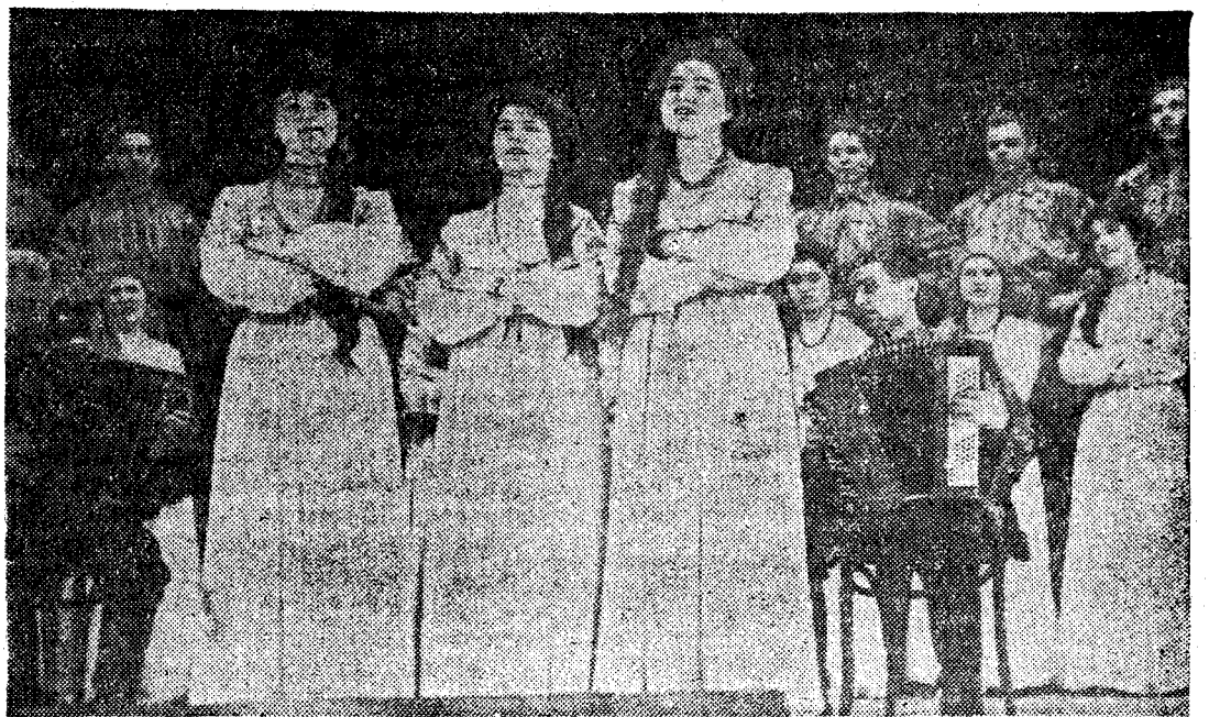
На снимке: хор завода «Кузбассэлемент» на смотре художественной самодеятельности.

Прошедший смотр раз и навсегда выбыл из-под ног почву у тех, кто пытается объяснить свою бездеятельность жалобами на плохие условия работы, на тесноту клубов и комнат для репетиций. Именно те коллективы, у которых нет даже элементарных условий для репетиций, не считая, ко-