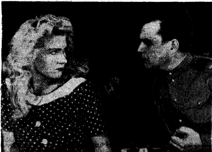
На снимке: сцена из спектакля «Барабанщица».