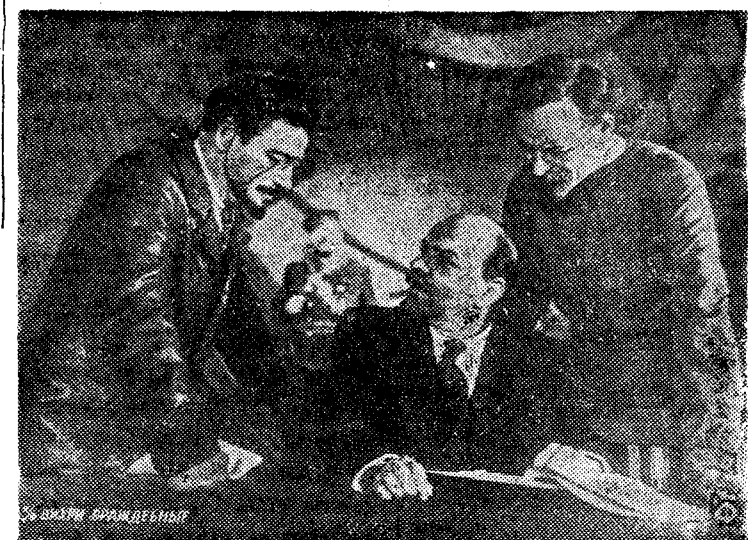
Кадр из кинофильма «Вихри враждебные»

Однако создатели фильма так настойчиво искали конкретное, индивидуальное, бытовое в Ленине, что в некоторых случаях отвлекались от решения главной задачи — воплощения образа вождя социалистической революции, гениального мыслителя и борца.