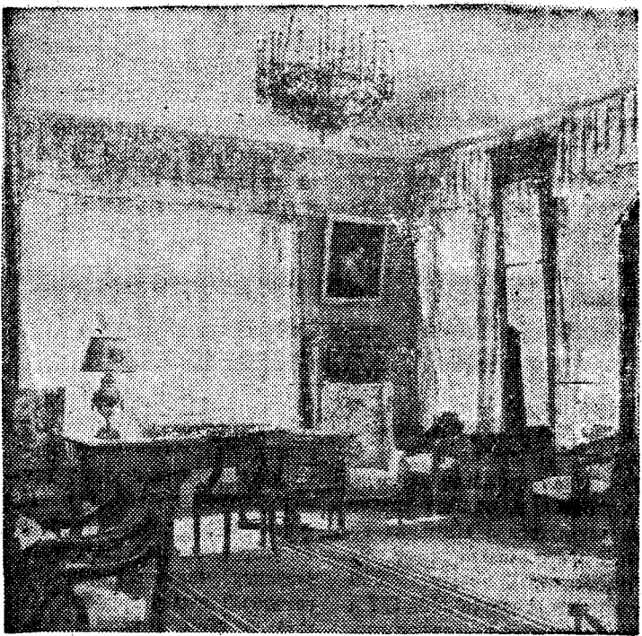
Дом-музей В. И. Ленина в Горках. Кабинет В. И. Ленина.

И. РОМАНОВ. член Общества по распространению политических и научных знаний.