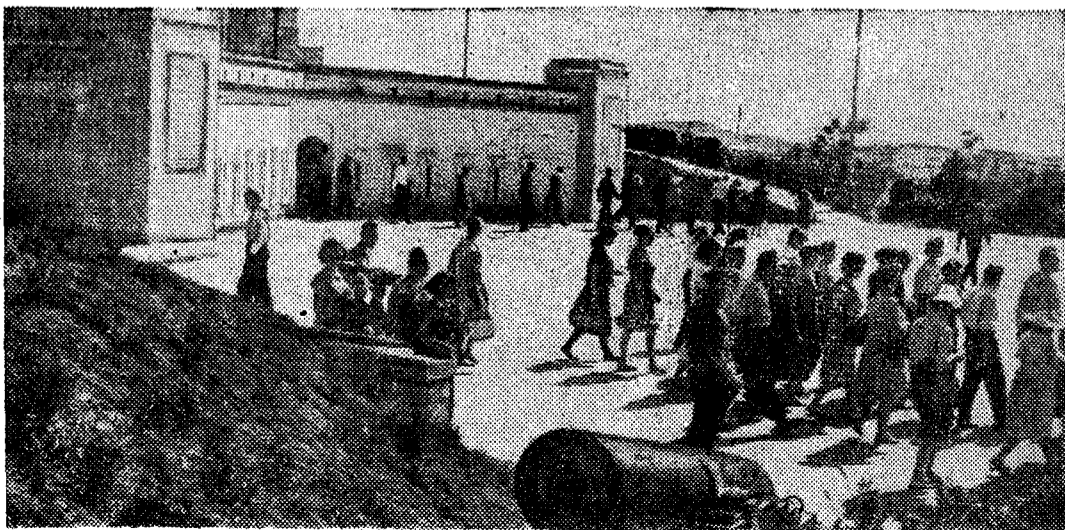
Севастополь. У древней Нахимовской башни горда-героя, на которой зажжен Вечный огонь.