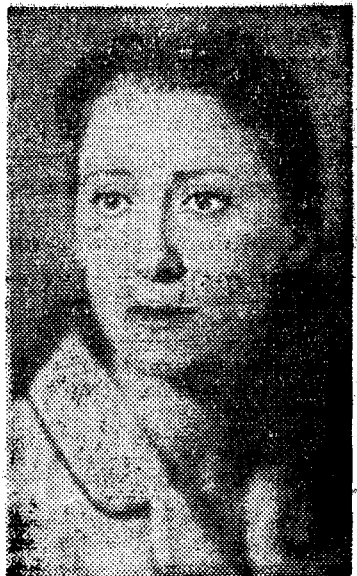
М. М. Плисецкая.

Можно десятки раз смотреть «Лебединое озеро» (мировой рекорд, наверно, принадлежит бывшему послу США в СССР Ллуэллину Томпсону, который за двадцать лет дипломатической карьеры в Москве видел «Лебединое озеро», если верить журналу «Лук», 179 раз) с Плисецкой в роли Одетты — Одиллии, можно знать наизусть все партии, но никогда не привыкнешь к ослепительному фейерверку, зажигаемому перед зрителями балериной. Не привыкнешь потому, что происходящее на сцене не воспринимается как спектакль; история, рассказываемая Майей Плисецкой, каждый раз развивается как происходящее на наших глазах событие.