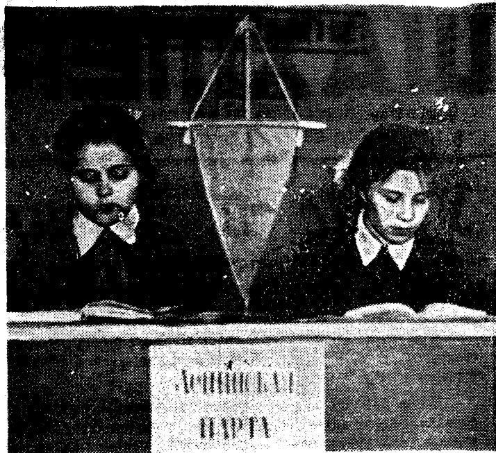
В ЧЕСТЬ 94-й годовщины со дня рождения Владимира Ильича Ленина в школе-интернате № 5 нашего города введена «Ленинская парта».

Прежде чем занять место на «Ленинской парте», отличник учебы обсуждается на совете отряда. И только когда совет отряда скажет: «Достоин», — ученик или ученица занимает парту. И тогда нужно учиться только на «пятерки», нужно жить только так, как учил Ильич.