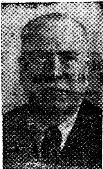
А. А. ДЕЙНЕКА

Георгий НИССНИЙ, заслуженный деятель искусств РСФСР, лауреат Государственной премии, действительный член Академии художеств СССР