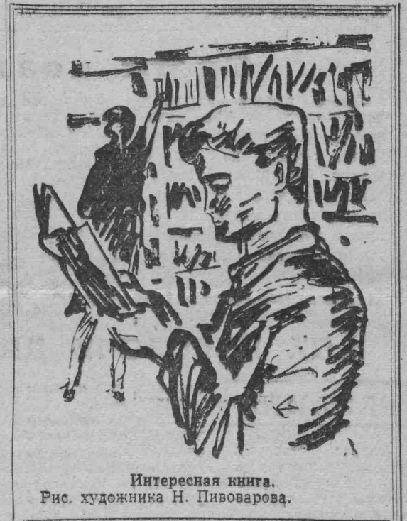
Интересная книга. Рис. художника Н. Пивоварова.