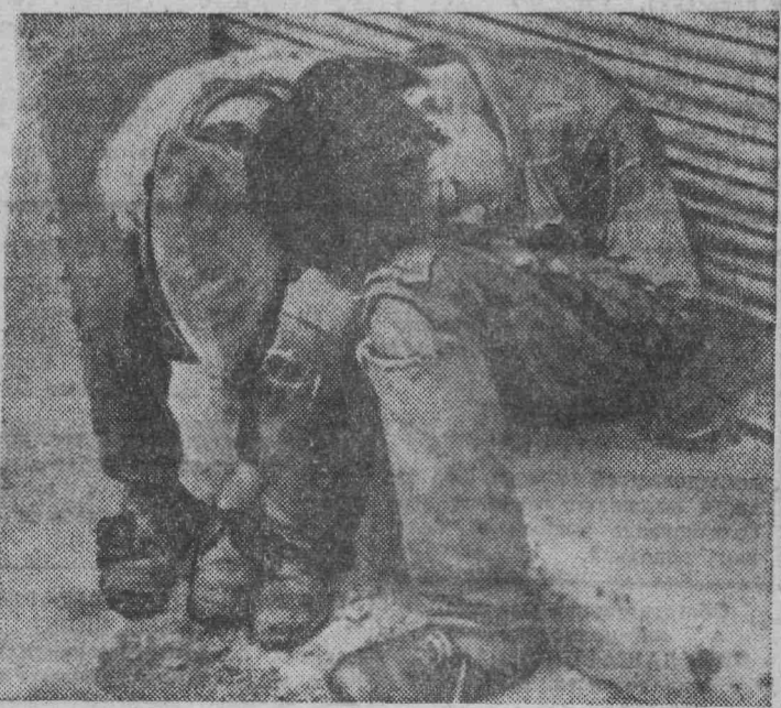
В Колумбии стоимость жизни за последние годы выросла в несколько раз. Заработной платы рабочим не хватает для того, чтобы прокормить семьи. Во многих городах и на дорогах страны можно встретить грязных оборванных малышей, скитавшихся в поисках пищи. Усталые, они засыпают там, где застанет их ночь.

совали за переизбрание Кваме Нкрума президентом республики.