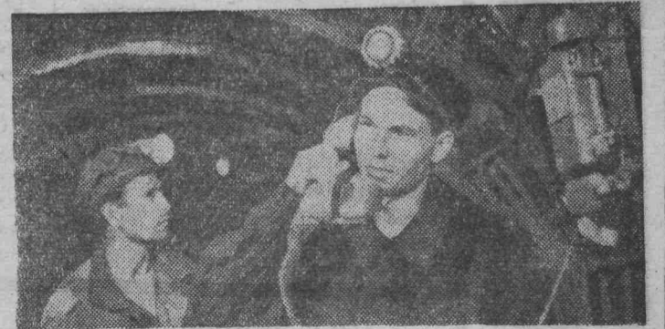
Звонком диспетчеру: «подавайте вагонетки!»