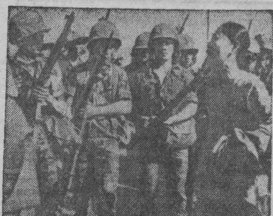
ЮЖНЫЙ ВЬЕТНАМ. Марionеточная сайгонская антинародная клика намеревается в нынешнем году увеличить на 160 тысяч свою шестисоттысячную армию.

На снимке: солдаты марionеточной армии разгоняют антиправительственную демонстрацию в районе Сайгон-Шолом.