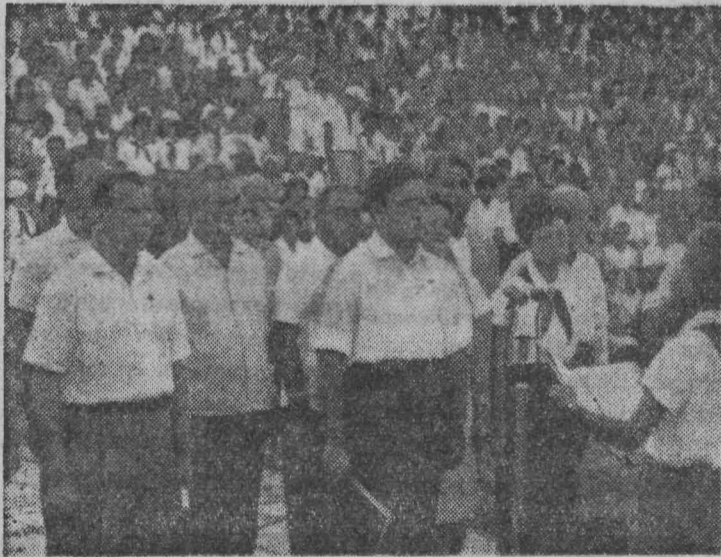
Звучат слова пионерского рапорта

Мало кто знал тогда о палаточном городке, раскинушемся на берегу Черного моря, в котором отдыхало несколько десятков ребят. А теперь это всем известный международный пионерский лагерь имени В. И. Ленина «Артек», где отдыхают около 40 тысяч мальчишек и девочек.