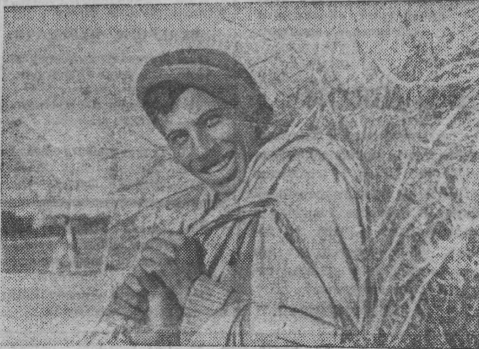
Афганистан. Крестьянин из Джалалабадской долины.

● ПРЕЗИДЕНТ ДЖОНСОН объявил на пресс-конференции о своем решении немедленно увеличить численность американских войск в Южном Вьетнаме с 75 тысяч до 125 тысяч человек. Президент заявил, что США останутся в Южном Вьетнаме и не откажутся от своих обязательств перед Сайгоном.