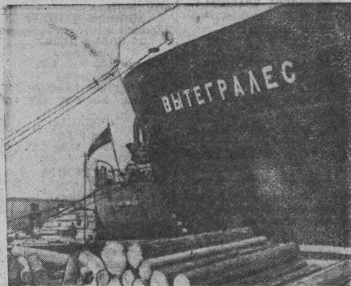
Советские торговые суда — частые гости в портах Ливана. Сюда доставляются металл, лесоматериалы и другие промышленные товары. Обрато корабли уходят нагруженные предметами традиционного ливанского экспорта.

На снимке: советские корабли «Константиновка» и «Вытеградец» в порту Триполи.