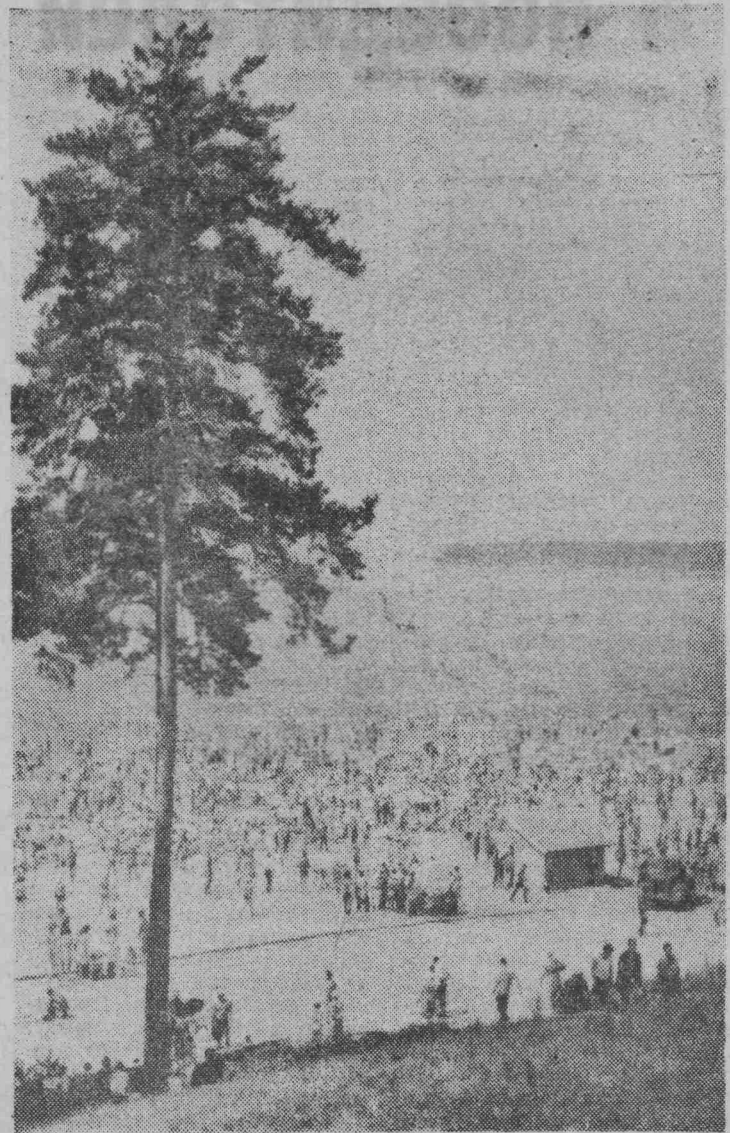
НОВОСИБИРСК. В воскресный день на пляже Обского моря.