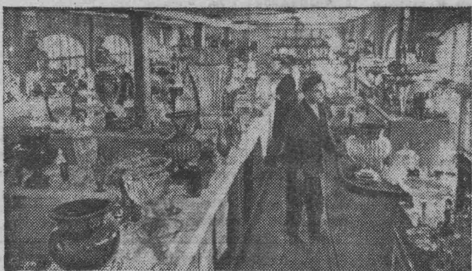
Брянская область. В заводском музее, где экспонируются лучшие изделия, созданные рабочими.