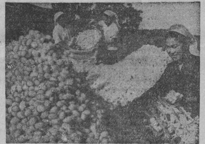
Корейская Народно-Демократическая Республика. Хорошо потрудились в этом году шелководы сельскохозяйственного кооператива Ренюн в провинции Южный Хамген.

Сырье сдаётся шелкомотальной фабрике. На снимке: сбор коконов в сельскохозяйственном кооперативе Ренюн.