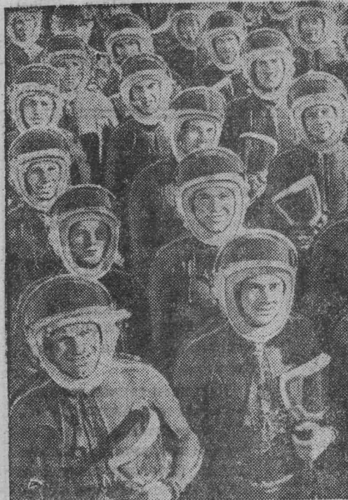
У каждого из них свой характер, свой воздушный «почерк».

осуществлен выход человека в космическое пространство. За годы Советской власти больших успехов достиг Гражданский воздушный флот, оснащенный реактивными и турбовинтовыми самолетами и вертолетами. Работники гражданской авиации вносят ощутимый вклад в дело выполнения планов семилетки. В День Воздушного Флота СССР советский народ славит деятелей авиационной науки и техники, своих военных и гражданских летчиков, спортсменов-авиаторов, которые крепят могущество строящей коммунизм Страны Советов.