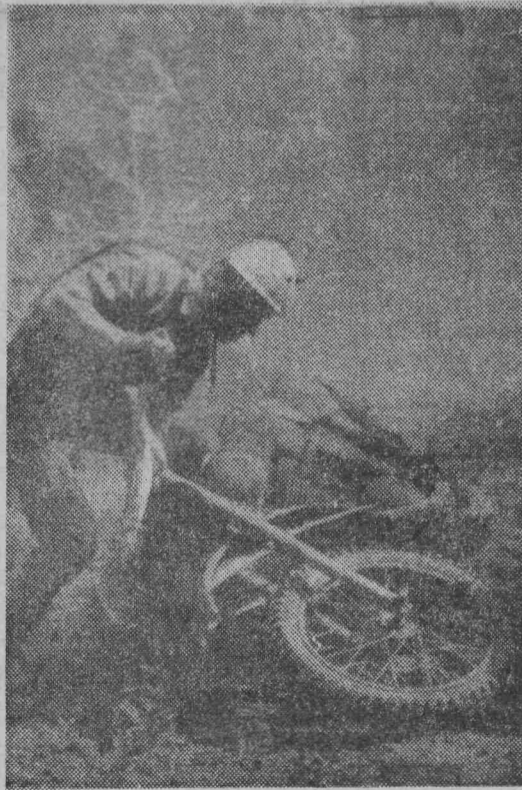
И так бывает...

Шахтоуправление, партийный и шахтовый комитеты шахты имени С. М. Кирова с глубоким прискорбием извещают о безвременной смерти после продолжительной болезни заместителя главного инженера шахты