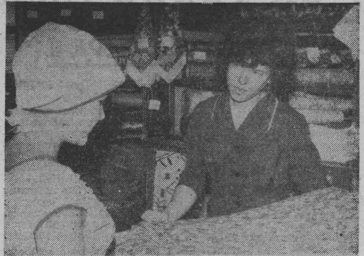
— Сколько нужно ткани на платье девочке? — женщина показывает на малышку.

Путь по этому самому кругу пришлось совершить и мне. Хотелось верить, что он разомкнется и женщина, наконец, получит работу. Но это только казалось. На самом деле круг еще более увеличился, включив в себя областную пси-