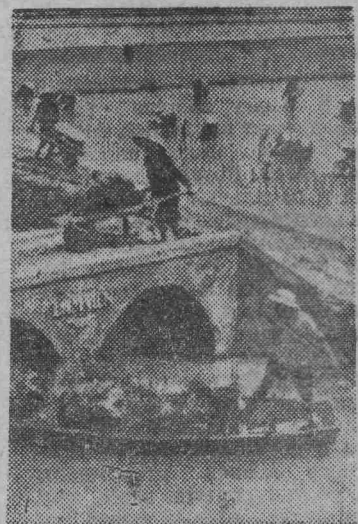
Во всех провинциях Демократической Республики Вьетнам широко развернулось движение за сбор высокого урожая риса.