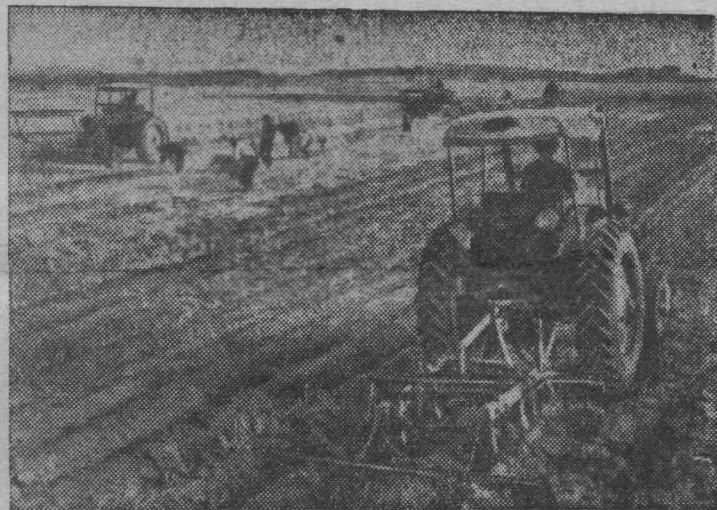
Корейская Народно-Демократическая Республика. На снимке: уборка зерновых в провинции Южный Хванхэ. На переднем плане — лущение стерни.