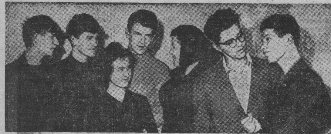
Они будут голосовать впервые. (См. на Т-й стр. заметку «Горят огни агитпункта»)

ЭТОТ разговор я подслушал нечаянно в универсаме. Собеседники хотели, чтобы их подслушали. Парень, почти мальчишка, одетый с претензией на моду, но как-то небрежно, развинченной походкой подошел к юной продавщице-практикантке и заговорил на весь салон: