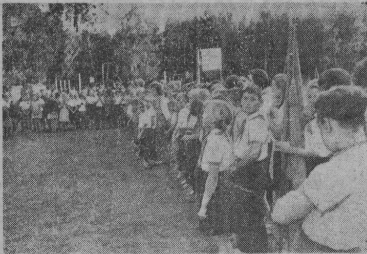
Прозвучала команда «Спустить флаг!»