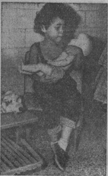
Эта маленькая «мама», баюкающая куклу, — воспитанница интерната для детей-сирот. В Кубинской Республике созданы детские учреждения, в которых воспитываются и учатся ребята, потерявшие родителей.

«Ведь привыкнешь чуть ли не к стенам раскомандировки, не говоря уже о лавах. Я к ней, к лаве, привираю, привыкаю. И вдруг эта производственная необходимость, — рассказывал Петр Щербинин, комбайнер с шахты имени 7 ноября. — Пошлют бригаду на другой участок и будто людей подменяют. Они те же и уже не те. Ведь знают, что временно их сюда прислали, что они на другом участке вроде сбоку припека. Как-то и с начальником участка говорить о делах не хочется. Ведь не знаешь человека. И он тебя не знает. Пока этот контакт взаимопонимания возникнет! На все время надо. А там, глядишь, люди по одному — двум отсеиваются — и нет уже бригады. Часто у нас на «Семерке» эти ненужные перегоны делают...»