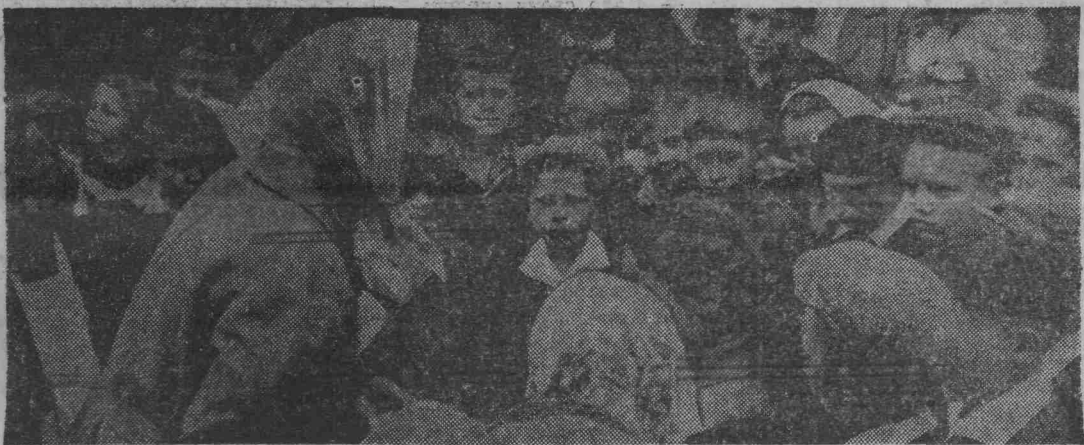
Фото и текст В. Даникова.