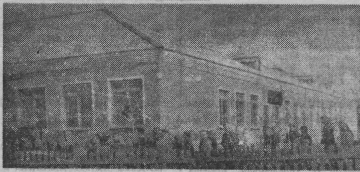
Рейд «Ленинского шахтера»