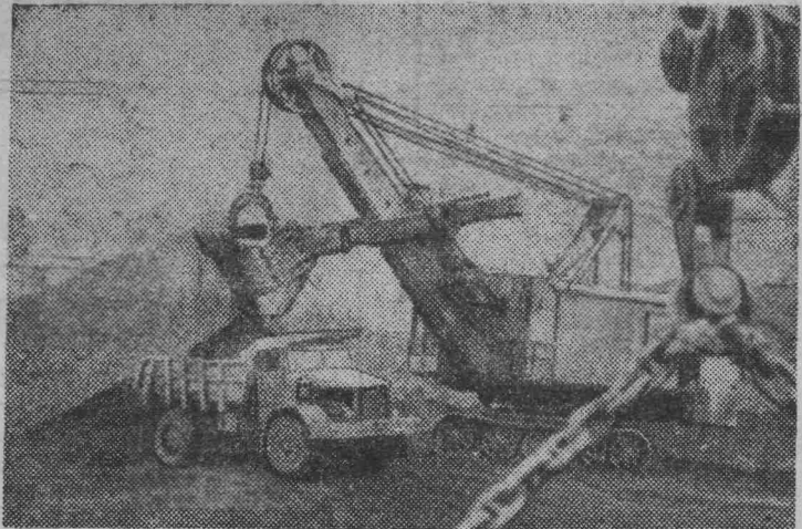
Коллектив крупнейшего в Кузнецком бассейне Красногорского угольного карьера досрочно выполнил задание и сейчас трудится в счет будущей пятилетки.

На участках карьера-гиганта развернулось социалистическое соревнование за достойную встречу 48-й годовщины Великого Октября. В честь знаменательной даты горняки взяли повышенные обязательства.