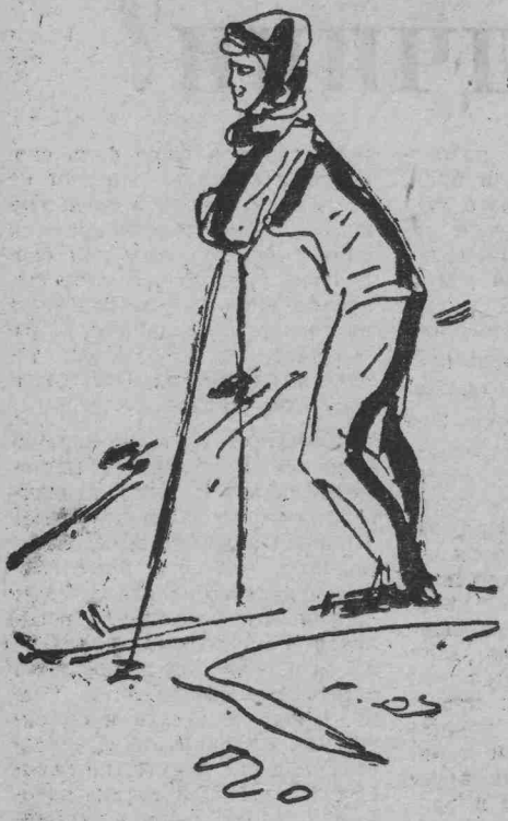
На прогулке Рис. художника Н. Пивоварова.