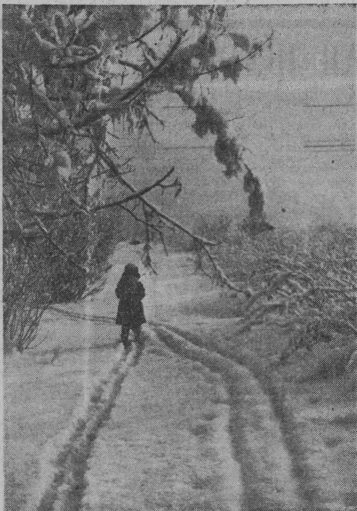
Человек идет по снегу.

В магазинах № 13 (пос. Мереть) № 6, 46 (шахта «Полысаевская-3»), № 20, № 40 (пос. Никитинка) орса протомаров треста «Ленинуголь» производится ПРОДАЖА ТОВАРОВ В КРЕДИТ по утвержденному перечню.