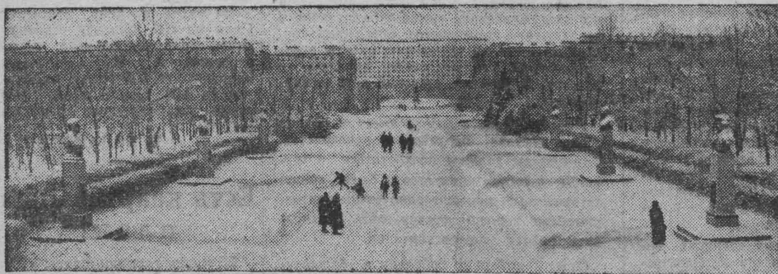
Ленинград. В честь победы над гитлеровской Германией трудящиеся Ленинграда заложили 7 октября 1945 года в Московском районе Парк Победы. За двадцать лет он разросся и стал любимым местом отдыха. Центральная аллея парка названа Аллеей Героев. Здесь установлены скульптурные бюсты дважды Героев Советского Союза — ленинградцев, прославившихся своими подвигами в дни Великой Отечественной войны.

На снимке: Аллея Героев в Парке Победы Московского района.