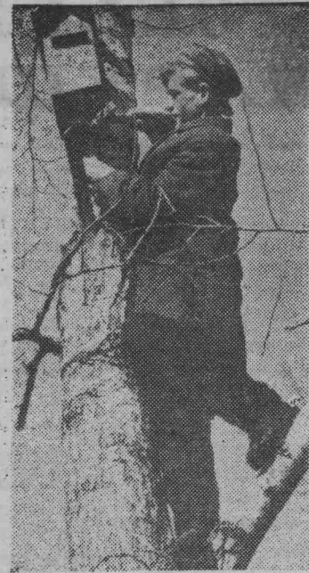
Для пернатых друзей.

В. ЗАГОРОВСКИЙ, сотрудник общественной приемной газет «Кузбасс» и «Ленинский шахтер».