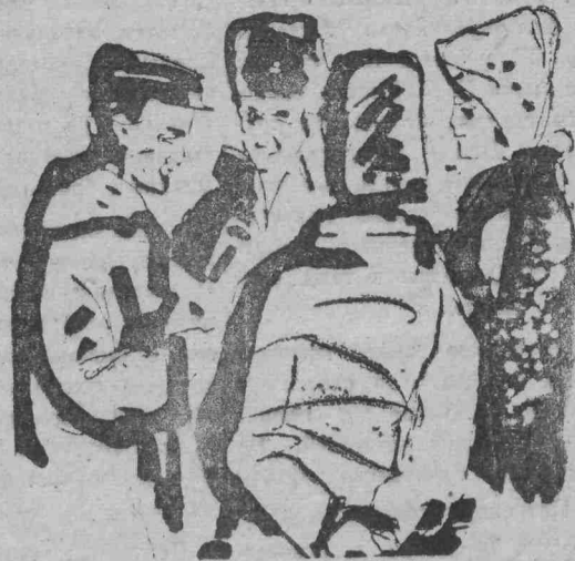
В перерыв строителям можно пошутить.