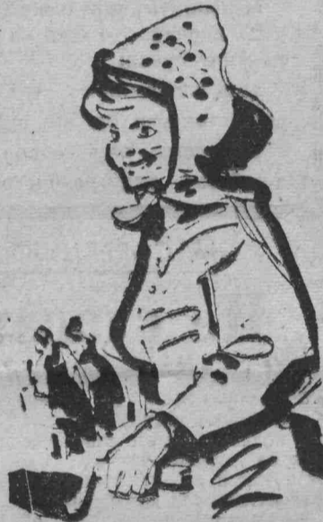
Рис. Н. ПИВОВАРОВА.