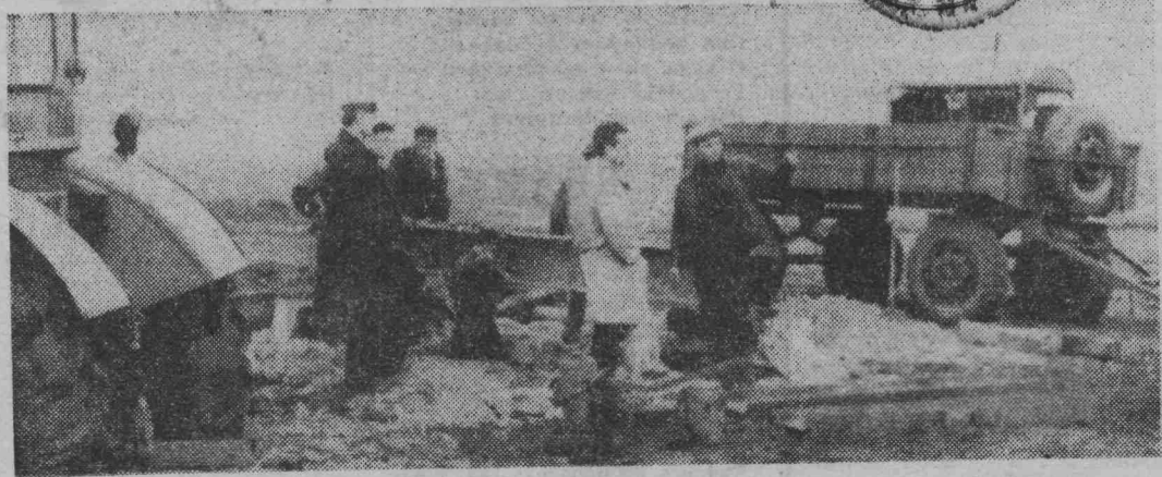
Скоро здесь, на пустыре в районе поселка Лапиновка, встанут корпуса фабрики костюмных тканей. Видите, работы уже начались.