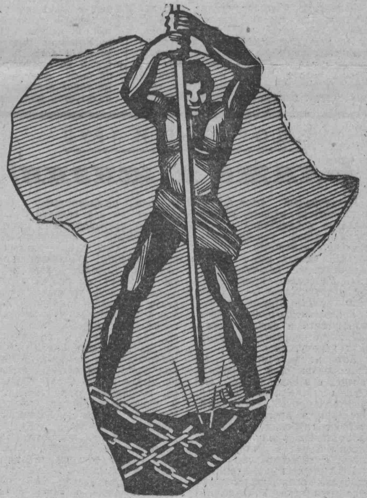
Колониализм обречен! Плакат художника Э. Ариурияна. (Издательство «Советский художник».)

Империализм пытается помешать становлению экономической независимости освободившихся стран, навязать им свою неокOLONIALISTскую политику, расколоть складывающееся единство африканских стран. Главным носителем современного неокOLONIALISTзма являются США. Свыше 200 американских компаний действуют в различных африканских странах. На вложенный капитал они ежегодно выкачивают около 25 процентов прибыли.