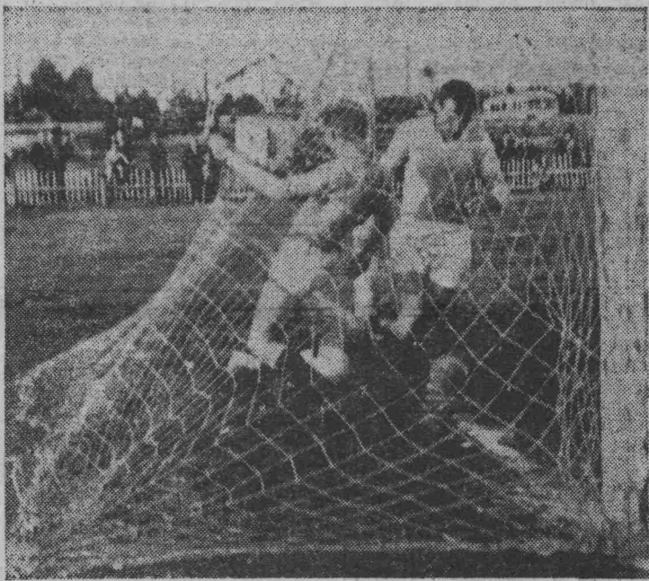
На снимке: момент из встречи «Ярославца» с НКХК. Гол в воротах гостей.