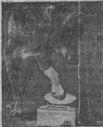
Кашалот во время охоты на спрута может нырнуть в глубины океана на 1.000 метров и находиться там, где