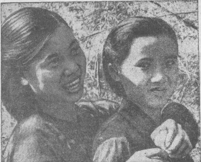
ДЕМОКРАТИЧЕСКАЯ РЕСПУБЛИКА ВЬЕТНАМ. На всю страну прославился высокими урожаями кооператив «Красный восток» в провинции Тханьхоа. До 70 центнеров риса с гектара получают здесь крестьяне. Многие юноши и мужчины ушли в армию. Основная тяжесть нелегкого труда легла на женщин. Они работают сейчас за двоих, забывая о сне и усталости.

23 ИЮЛЯ 18.30 Мультипликационные фильмы. 19.00 Прочти, это интересно! 19.20 Кинохроника. 19.50 Мы — врасплох. Фоторепортаж. 20.00 Международное обозрение. 20.15 «Гостеприимное море». Документальный фильм. 20.30 Телевизионные новости. 20.40 Киножурнал. 20.50 Спектакль Пермского театра оперы и балета им П. И. Чайковского.