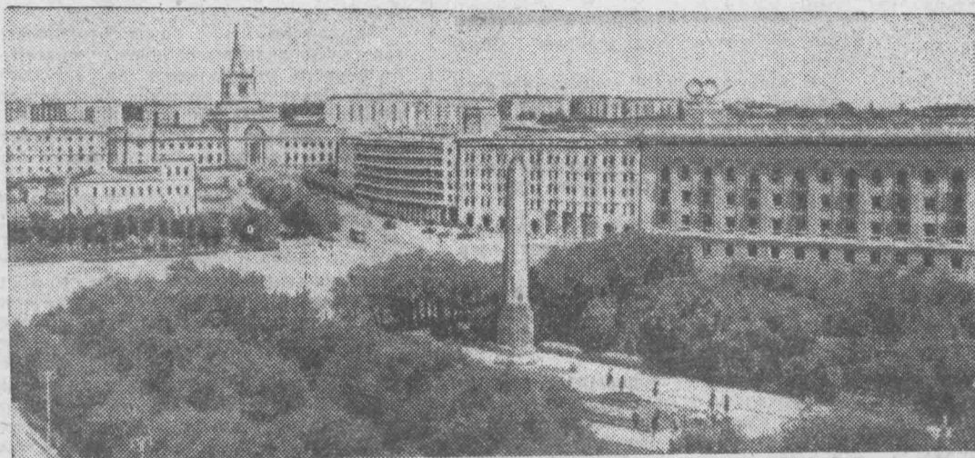
Святыня Волгограда — площадь Павших Борцов. Здесь день и ночь горит вечный огонь, воздавая памятную славу защитникам города.

Из руин и пепла поднялся один из красивейших городов страны. Трудно поверить, что двадцать три года назад на его улицах были лишь развалины. А сейчас на их месте выросли заводы и жилые дома, пролегли широкие, утопающие в зелени улицы и проспекты. Каждый год в городе сдаются в эксплуатацию свыше десяти тысяч новых квартир. Жилой фонд города по сравнению с довоенным вырос втрое.