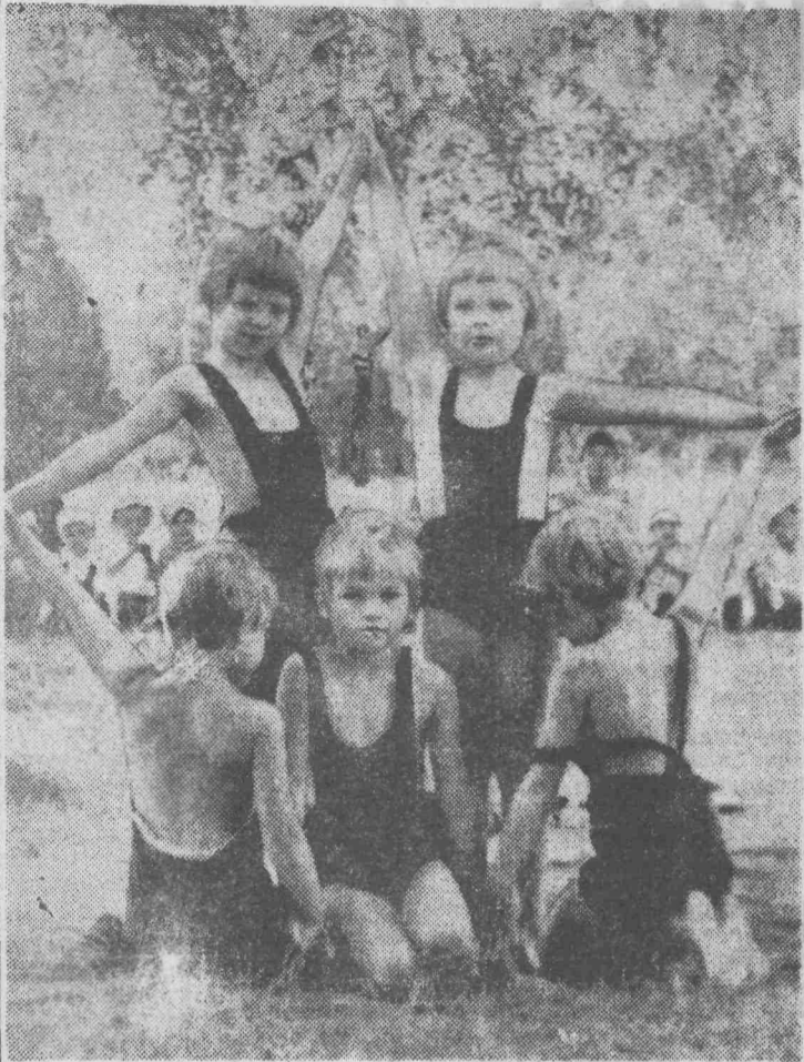
В трех километрах от села Драченино, на берегу реки есть живописный уголок, окаймленный нежными березками и разлапистыми елями. Здесь расположена дача, где отдыхают дети горняков шахты имени Кирова. Ребята учатся петь, танцевать, выполнять гимнастические номера.