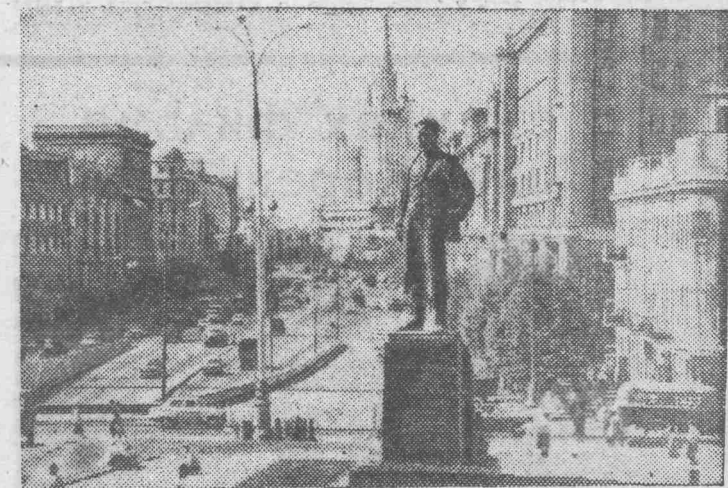
Москва сегодня. Площадь Маяковского.