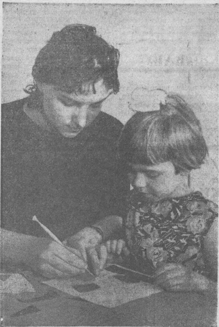
Завтра в школу!